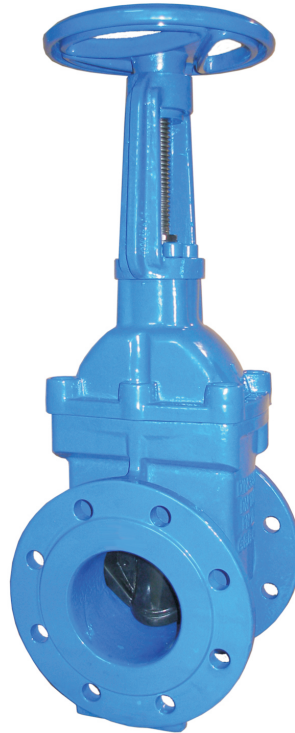
Na zdjęciu DN100

Задвижка клиновья с выдвигаемым шпинделем